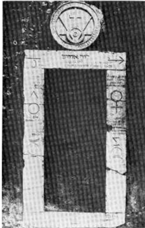
Porta Magica i Rom

Vissa vill gärna dra den förhastade slutsatsen att R. et A.C. har ett italienskt ursprung, trots att det samtidigt finns så starka kopplingar till Tyskland i monument såsom Porta Magica och Madathanus. En annan tysk alkemist, Michael Maier, använde titeln Arcana Arcanissima till sin första bok redan så tidigt som 1614, samma år då Fama Fraternitatis gavs ut i Tyskland. Mycket talar därför för att Rosenkors-traditionen föddes ur den tyska myllan.